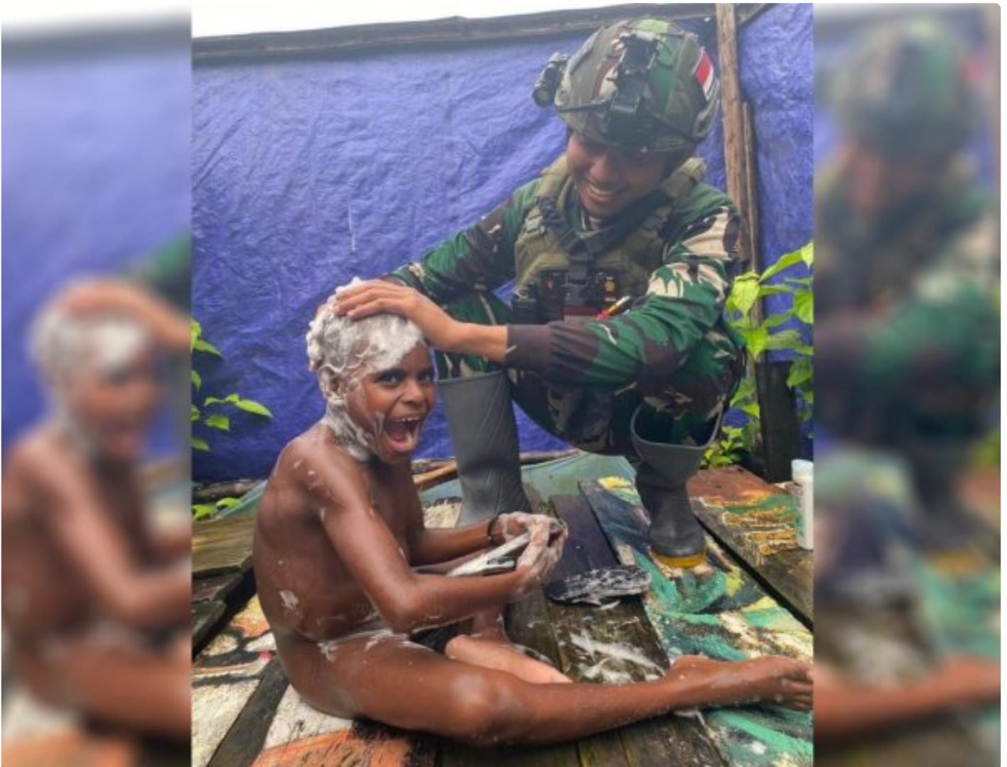
Foto: Saat Satgas Pamtas Mobile RI-PNG Yonif 503/Mayangkara Koops Habema Mengajarkan Anak-anak Menjaga Kebersihan Dengan Mandi Air Bersih di Pos Batas Batu, Kecamatan Batas Batu, Kabupaten Nduga, Papua Pegunungan, Kamis (04/07/2024).

NDUGA- Satgas Pamtas Mobile RI-PNG Yonif 503/Mayangkara Koops Habema mengajarkan anak-anak di daerah operasi untuk menjaga kebersihan dengan Mandi air bersih di Pos Batas Batu, Kecamatan Batas Batu, Kabupaten Nduga,