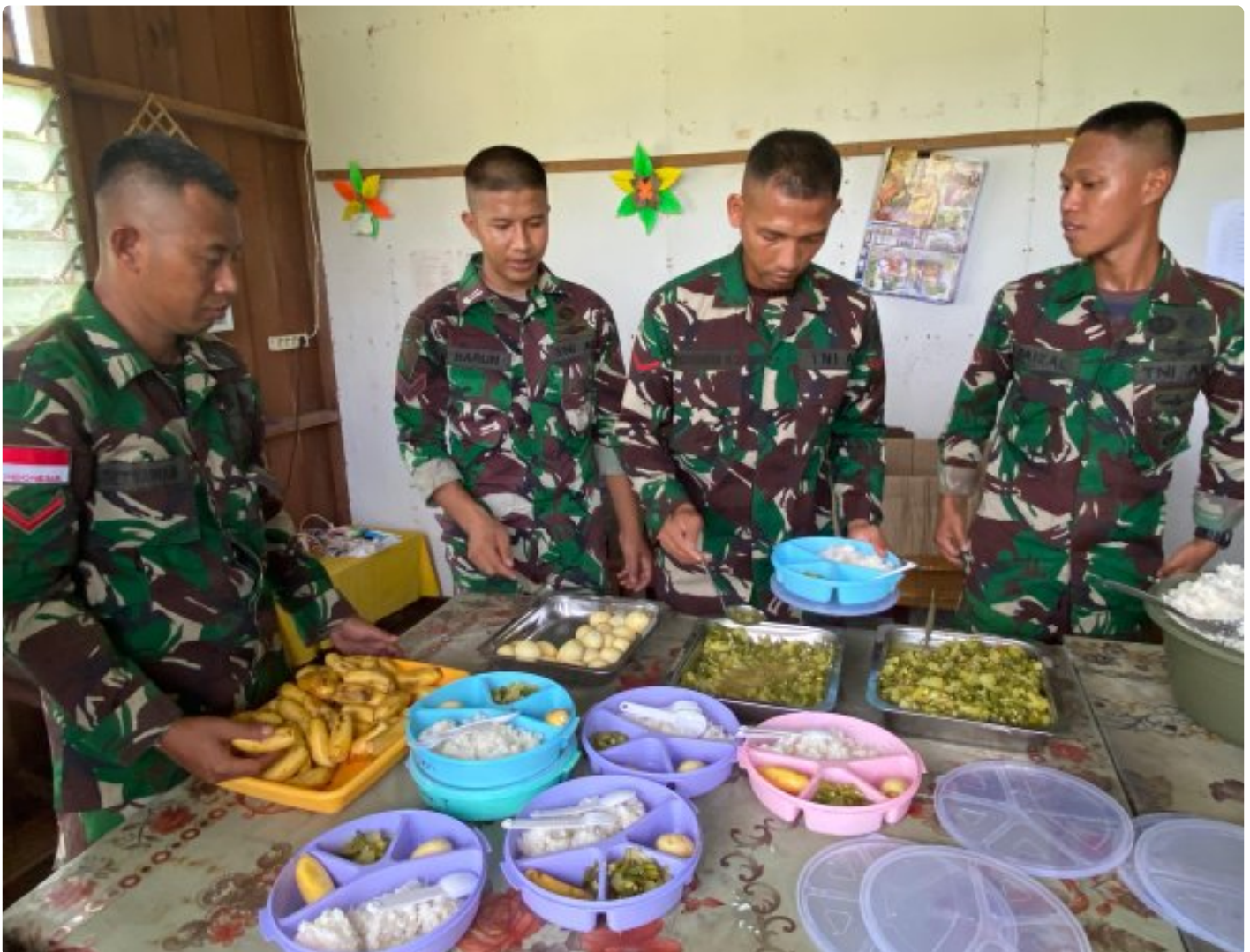
Foto: Dedikasi Satgas Pamtas Mobile RI-PNG Yonif 503/Mayangkara dalam mendukung program makan bergizi gratis pemerintah mendapat apresiasi tinggi dari masyarakat Distrik Krepkuri, Kabupaten Nduga, Papua, di sekolah rimba, Rabu (29/01/2025).

NDUGA- Dedikasi Satgas Pamtas Mobile RI-PNG Yonif 503/Mayangkara dalam